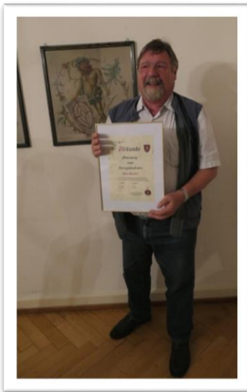
Ein stolzer Ehrenpräsident mit der Urkunde