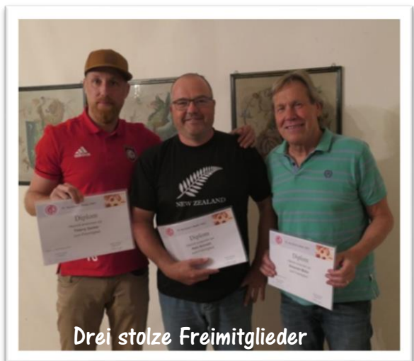
Drei stolze Freimitglieder