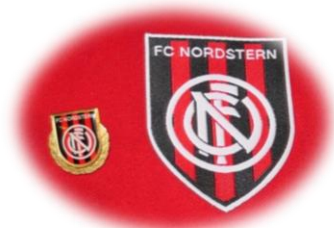
Ehrennadel für Ehren- und Freimitglieder