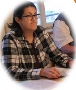
Warum so skeptisch? Die Bilanz ist ja schwarz!