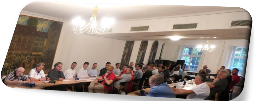
Die anwesenden Mitglieder